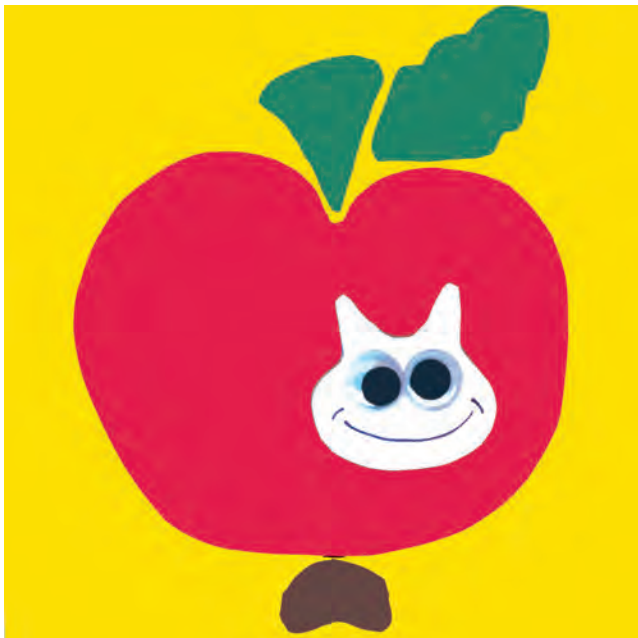
Apfel aus Moosgummi