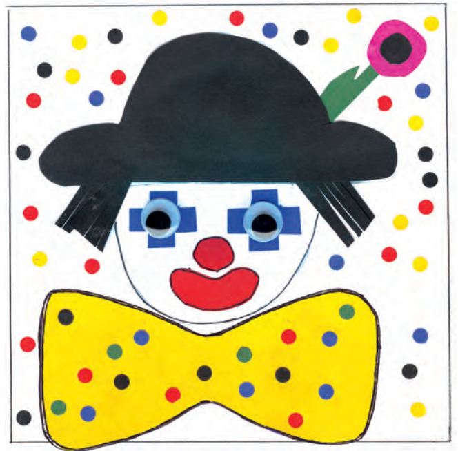
Clown aus Tonpapier