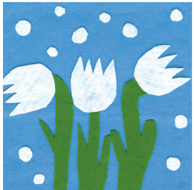
Schneeglöckchen aus Filz