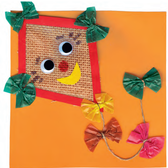
Drachen aus Jute