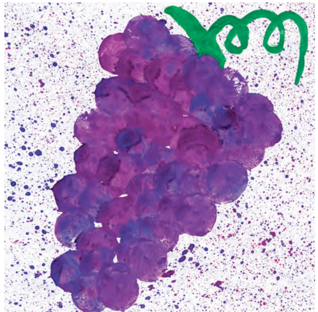
Saftige Weintrauben mit Korkendruck und Spritztechnik