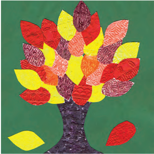
Herbstbaum aus Tapetenresten