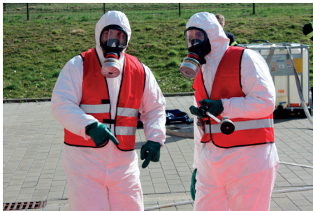
Abb.: Freiwillige Feuerwehr Langen