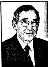
LE SURSAUT DE L'ARMÉE ALLEMANDE

Au fond ce n'est pas l'épuisement de l'armée allemande de 1918 qui peut nous surprendre : l'efficacité du blocus économique et les innombrables restrictions qui épuisent la population, jointes au déséquilibre des effectifs ne pouvaient qu'affaiblir et démoraliser l'armée allemande. Ce qui, en revanche, peut étonner, c'est la brièveté apparente du basculement, en quelques semaines, voire quelques jours, entre le 18 juillet et le 8 août. Friedensturm , offensive de la dernière chance, se termine par un échec, et précipite le repli – en bon ordre – des forces germaniques. Mais pouvait-il en être autrement ? La ferme résistance des troupes alliées, dirigées par un commandement unique, et le raz de marée américain ne laissaient pas de chance aux Allemands. La paix de compromis n'était pas à l'ordre du jour, et le temps jouait contre eux : il leur restait à demander l'armistice.