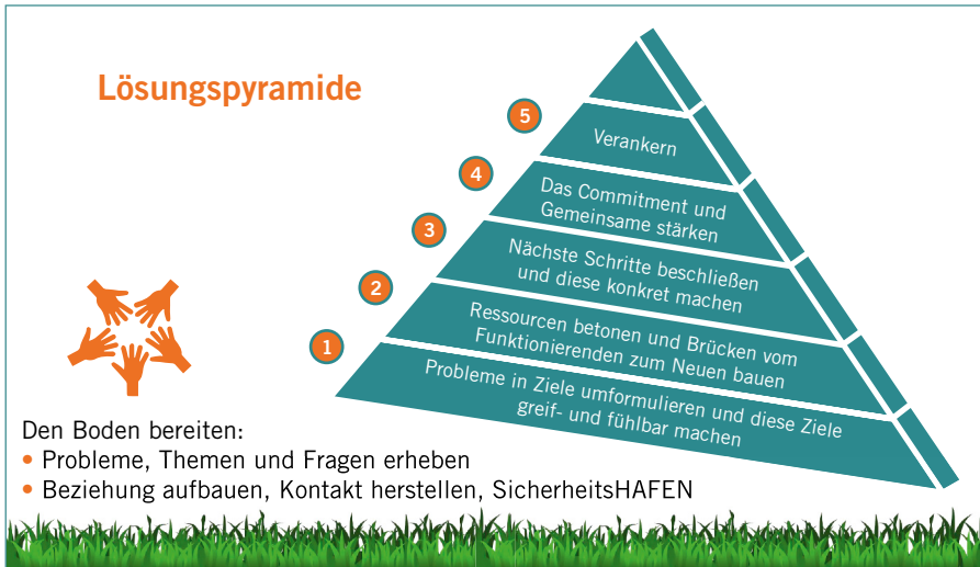
Abbildung 21: Die Lösungspyramide führt Sie Schritt für Schritt durch den Coachingprozess