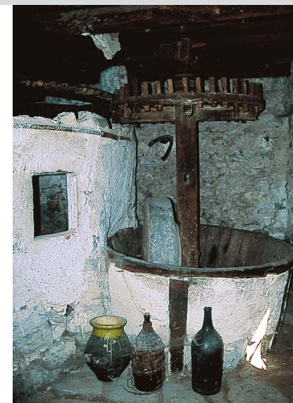
L'ancien moulin à huile de Rigaud.

Après 15 min de marche, on arrive à une bifurcation : on suit ici le sentier qui descend légèrement et on arrive après quelques pas directement au lit dans lequel s'écoule un petit ruisseau. Environ 100 m en amont, sur l'autre rive, on peut repérer une balise (#205) près d'un gros rocher lisse de 2 m sur 3 m. De là, on continue encore 20 m en amont puis le sentier sinueux commence à grimper sur la droite. Après quelques minutes, le sentier se divise et on prend à gauche (balisage rouge-blanc du GR en forme de crochet). À partir d'ici, impossible de se tromper. Le sentier serpente en remontant la vallée, généralement à l'ombre des arbres. Sur la gauche se dressent les imposants rochers de la Montagne de Mairola dont les