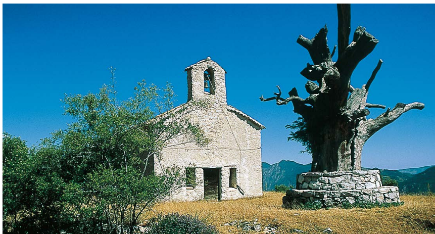
La Chapelle St-Julien.

Au début, le sentier suit encore la route, pour tourner ensuite à gauche dans le tronçon entre les deuxième et troisième virages. Le chemin aboutit à nouveau sur la route. On prend à gauche et après quelques mètres, encore à gauche sur le sentier forestier dans le virage suivant. Après quelques zig-zags, on rejoint à nouveau la route (réservoir d'eau) et on prend à gauche. Entre le virage suivant et celui d'après, il y a une fois encore un petit raccourci. Arrivé au virage suivant, on quitte définitivement la petite route : on prend à droite dans le tournant et après quelques mètres, tout de suite à gauche. De là, le sentier de randonnée nous ramène en une petite demi-heure à Rigaud (1) .