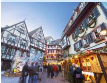
Weihnachtsmarkt in Colmar

Fête de l'Asperge (Spargelfest, Hoerd) – Seit 85 Jahren dreht sich Mitte Mai in der bäuerlich geprägten Gemeinde Hoerd alles um den weißen Spargel. Gefeierte wird mit viel Musik, Frohsinn und einem Straßenmarkt ( www.hoerd.fr und www.jds.fr ).