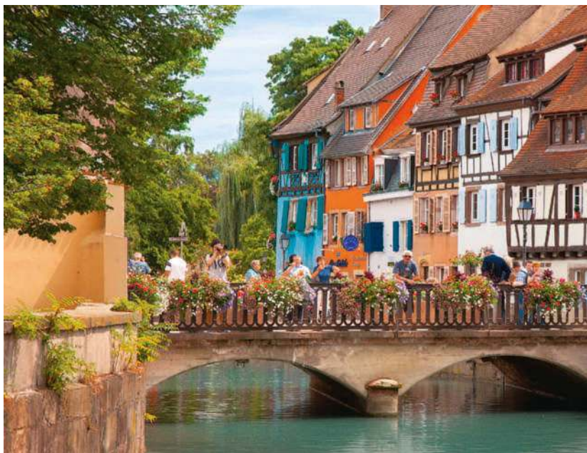
La Petite Venise, das Viertel am Ufer der Lauch, ist Colmars Touristenmagnet

Willkommen im elsässischen »Klein-Venedig«!