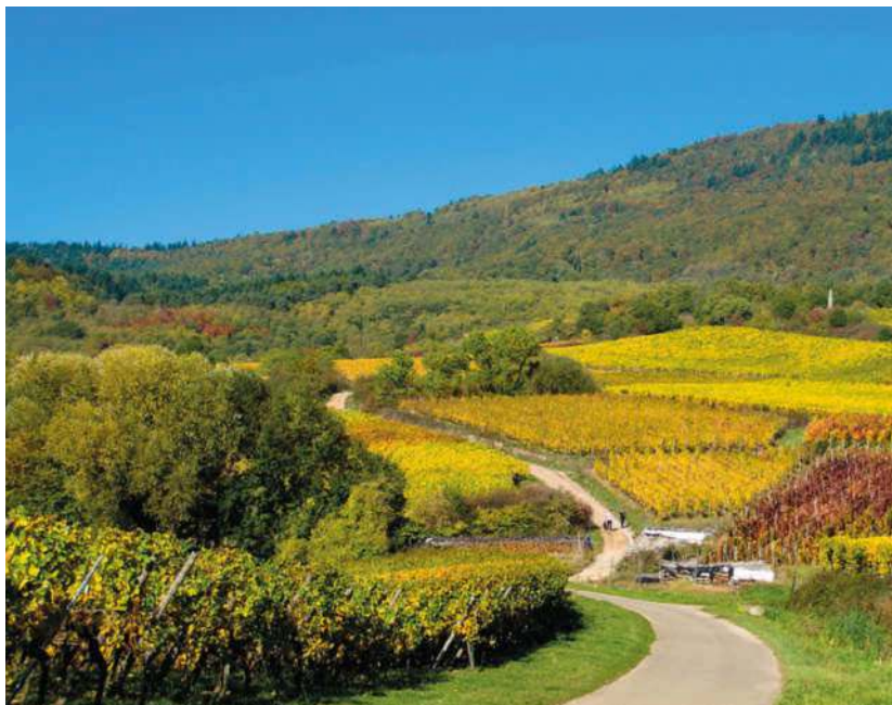
Auf einem bewaldeten Bergrücken bei Orschwiller thront die Burg Haut-Kœnigsbourg

Willkommen in einer gesegneten Landschaft, bei sympathischen Nachbarn mit Hang zu Genuss und Gelassenheit!