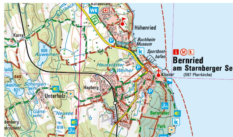
Ausschnitt aus UK50-41 Ammersee – Starnberger See – München Süd

Was bietet die Gegend noch? Kleinode der Natur wie zum Beispiel die Osterseen oder die Isar mit der Pupplinger Au. Sehr sehenswert sind die historischen Altstädte von Wolfratshausen und Weilheim i.OB mit ihrem ganz eigenen Charme und auch die Burg Grünwald. Für Kulturgebeisterte lohnt sich ein Besuch des Buchheim-Museums der Phantasie bei Bernried oder des Sissi-Schlusses in Possenhofen. Ein Muss ist zudem ein Ausflug auf die wunderschöne Roseninsel bei Feldafing deren prähistorische Pfahlbauten zum UNESCO-Weltkulturerbe gehören.