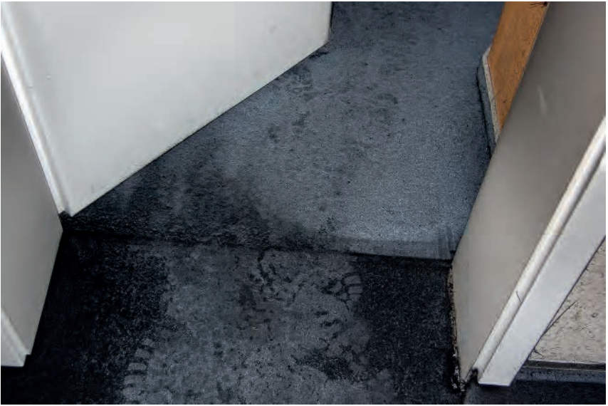
Bild 3: Abdrücke von kontaminierten Einsatzstiefeln jenseits der Schwarz/Weiß-Grenze lassen sich nicht immer vermeiden, sollten in manchen Fällen aber zum Nachdenken anregen.

Es wird uns nie gelingen, fehlerfrei zu arbeiten, perfekt zu werden. Wir müssen jedoch unsere Fehler erkennen und sie uns bewusst machen. Wir müssen nach den Ursachen der Fehler suchen und konsequent an der künftigen Vermeidung dieser Fehler arbeiten (Qualitätsmanagement). Die häufig gebrauchten Argumente wie »das haben wir immer schon so gemacht« beziehungsweise »das haben wir noch nie so gemacht« helfen uns dabei nicht weiter.