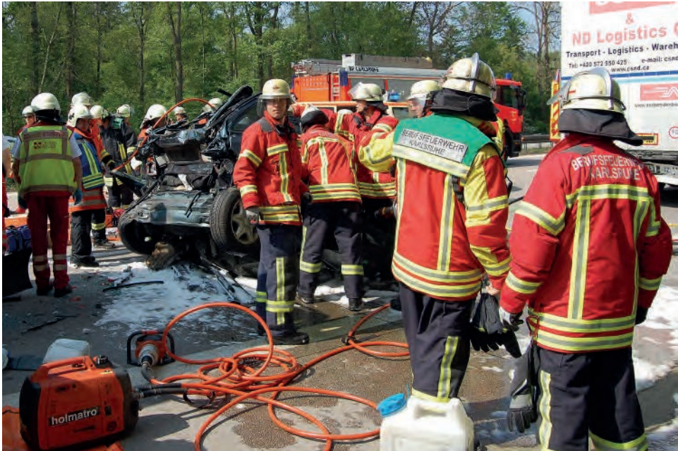
Bild 2: Feuerwehr ist Teamarbeit – nicht selten muss das Team unter Zeitdruck funktionieren. Detaillierte Absprachen sind oftmals nicht möglich, sodass die grundsätzlichen Überlegungen, Zielvorgaben und Handlungsabläufe im Vorfeld besprochen und trainiert sein müssen.

Der Zeitdruck an der Einsatzstelle erlaubt es meistens nicht, ausgiebige Lagebesprechungen durchzuführen. Bestimmte Handlungsabläufe müssen standardisiert sein und auf Zuruf ausgeführt werden können. Die grundsätzliche Denkweise der Führungskräfte muss der Mannschaft schon im Vorfeld vermittelt worden sein. Will man, wie in diesem Buch angeregt, zum Beispiel in bestimmten Lagen künftig mit einer modifizierten Taktik arbeiten und ungewohnte Wege beschreiten, so muss die Mannschaft durch Vorträge, Diskussionen und praktische Übungen darauf vorbereitet sein, um an der Einsatzstelle Diskussionen und Fehlinterpretationen zu vermeiden.