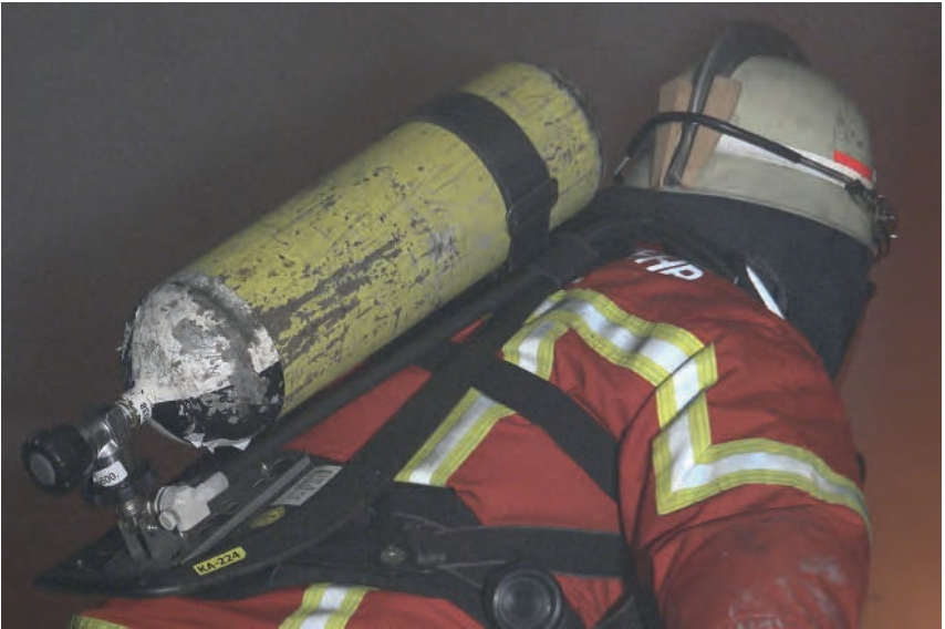
Bild 4: Der Holzkeil am Helm kann zielführend sein, sofern er mit Verstand eingesetzt wird.