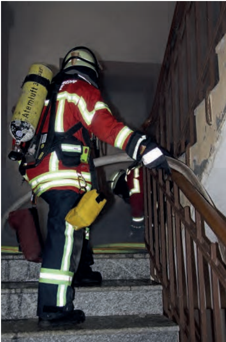
Bild 5: Treppenträume und Flure sind die Standard-Angriffswege der Feuerwehr. Es sind aber auch die baulichen Rettungswege für die Nutzer des Hauses und gleichzeitig die Zugänge, über die diese nach dem Brand wieder zu ihren Nutzungseinheiten gelangen sollen. Es gilt daher, Treppenträume und Flure auch im Zuge der Einsatzmaßnahmen nach Möglichkeit nicht zu verrauchen und/oder zu verschmutzen.