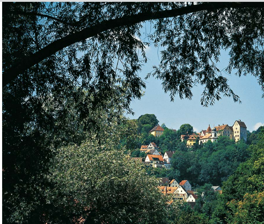
Der Ort Egloffstein wird von der gut erhaltenen Buranlage dominiert.

Einkehr: Ghs. in Egloffstein, Thuisbrunn (Mo, Mi und Do Ruhetag) und Großenhohe (Mi Ruhetag).