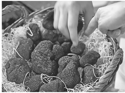
Abb. 1: Trüffelpilze

Bei Trüffelpilzen sehen die Fruchtkörper knollenförmig aus, wachsen unterirdisch und werden als Trüffel (siehe Bild rechts) bezeichnet. Sie besitzen ein nährstoffreiches Fruchtfleisch, in das die Sporen eingebettet sind, und eine feste Schale. Zur Reifezeit der Sporen verströmen Trüffeln einen intensiven Duft, der bis zur Erdoberfläche empordringt. Dieser Duft kann von vielen im Wald lebenden Säugetieren, wie Rötelmäusen, in geringen Konzentrationen wahrgenommen werden. Sie graben die Trüffeln aus, fressen sie, verdauen jedoch nur das Fruchtfleisch, die Sporen sind unverdaulich und werden an einem anderen Ort ausgeschieden. Trüffelpilze wachsen an mäßig trockenen Standorten, vertragen jedoch keine längeren Trockenperioden.