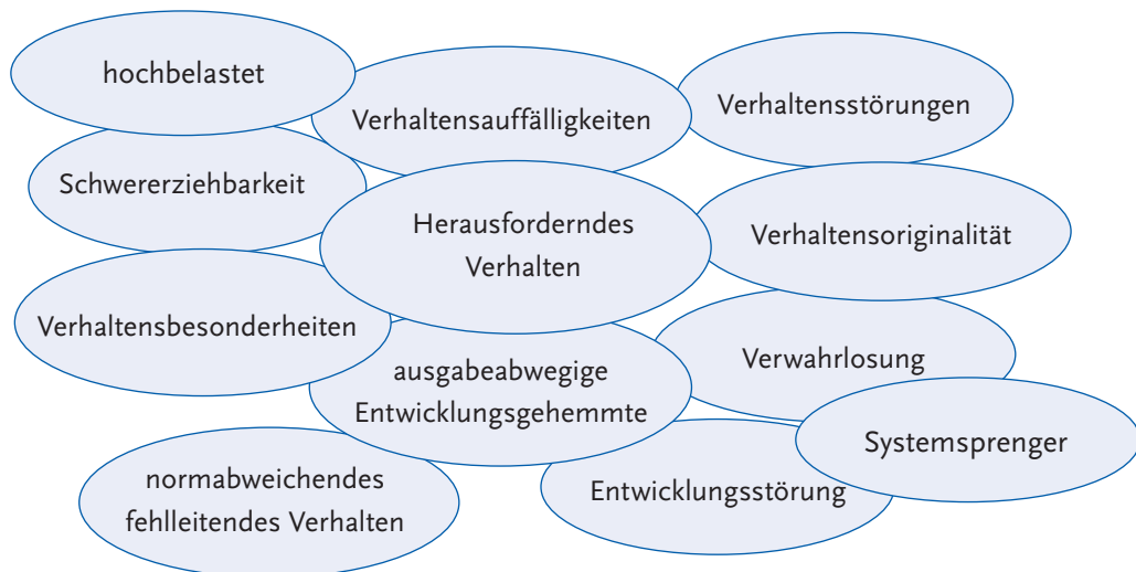
Abbildung 2: Verschiedene Bezeichnungen für herausforderndes Verhalten

Neben diesen kritisch zu betrachtenden Begrifflichkeiten existieren Begriffe, wie Verhaltensbesonderheiten oder Verhaltensoriginalität. Beide Begriffe entstammen dem Wunsch, Kinder mit auffälligen, störenden und herausfordernden Verhaltensweisen nicht als „in sich falsch“ zu stigmatisieren. Doch werden auch diese Begriffe der Notlage des Kindes und dem Anteil der materiellen und personalen Umwelt daran, den Veränderungsmöglichkeiten und der Notwendigkeit eines achtsamen, ernsthaften und fürsorglichen Umgangs durch die erwachsenen Begleitpersonen, nicht gerecht.