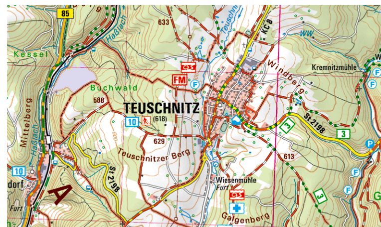
Ausschnitt aus UK50-4 Naturpark Frankenwald

Der Frankenwald bietet vielfältige Entdeckungsmöglichkeiten – im Herzen Deutschlands, aber abseits des Massentourismus.