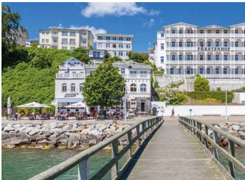
Prächtige Villen im Bäderstil säumen die Strandpromenade von Sassnitz

Liebenswerter Fischer- und Fährort mit Hafenflair