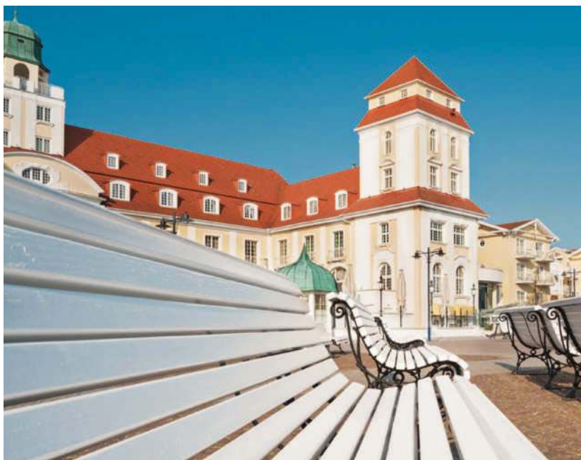
Das Kurhaus im Ostseebad Binz ist eines der Wahrzeichen Rügens

Rund 6,5 Mio. Übernachtungen werden auf Rügen jährlich gezählt. Die Insel punktet mit Schönheit und Ursprünglichkeit