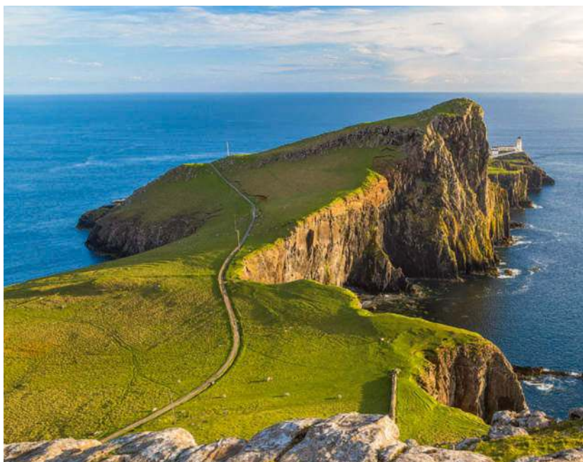
Spektakuläre Klippen am Neist Point markieren den westlichsten Punkt der Isle of Skye

Mit den sagenhaften Highlands, reizvollen Küsten und Inseln sowie kultureichen Metropolen ist in Schottland Abwechslung garantiert