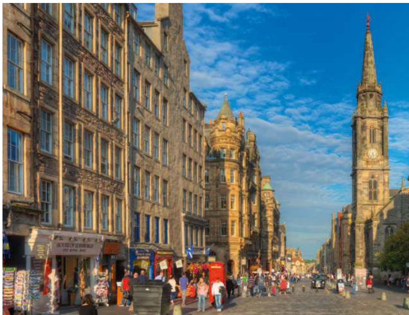
Die Royal Mile ist die zentrale Verbindungsachse in Edinburghs Old Town

Das kulturelle und administrative Zentrum des Landes