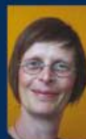
Clara Vasseur OSB (Text) Monika Schumacher (Illustration)