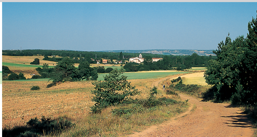
Vista de San Juan de Ortega.

i San Juan de Ortega (1080–1163) fue, después de Santo Domingo, el segundo mayor promotor del Camino de Santiago. Tras una peregrinación a Jerusalén, el discípulo de Santo Domingo se recluyó en los inhóspitos Montes de Oca. En agradecimiento por la milagrosa salvación durante una tempestad en el viaje de regreso, construyó la Capilla de San Nicolás en honor a San Nicolás de Bari. Más tarde abrió un hospital de peregrinos, ignorando la resistencia de los bandidos de los Montes de Oca. En torno a aquél se fue creando una pequeña comunidad monacal. Al igual que su modelo Santo Domingo, Juan mejoró el Camino de Santiago pavimentándolo y construyendo puentes. En el s. XV comenzó el declive del monasterio. En la actualidad se encuentra en proceso de restauración. El interior de la antigua Iglesia Monacal (ss. XII–XIX) combina el románico, como sus tres ábsides con capiteles muy bellos (s. XII), con elementos góticos de los siglos XIV/XV, como el sepulcro de San Juan. El palio gótico finamente labrado (en torno a 1464) reproduce escenas de la vida de San Juan, como su peregrinación a Jerusalén. El sarcófago que contiene los restos mortales del santo se encuentra en un nicho a la izquierda, bajo el capitel del Milagro de la Luz.