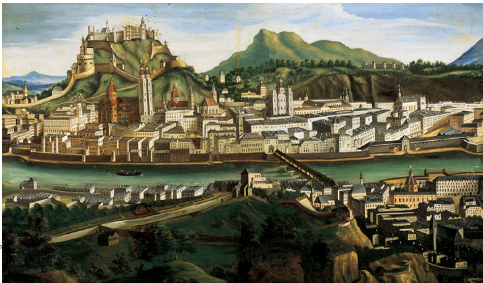
Вид на город Зальцбург (холст, масло, около 1756 г.). На этой картине хорошо видна пирамидальная крыша церкви Св. Петра. Только в 1756 г. в ходе перестройки церкви в стиле барокко был возведен купол в виде луковичы.