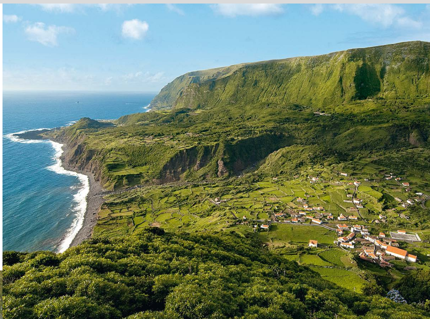
Fajãzinha sur l'imposante côte ouest de Flores.

d'habitation, suivez à droite un ancien chemin charretier qui monte et débouche après 15 min près du vieux moulin à eau Moinho da Ribeira da Alagoa (10) sur la route principale vers Fajã Grande (3 h 45).