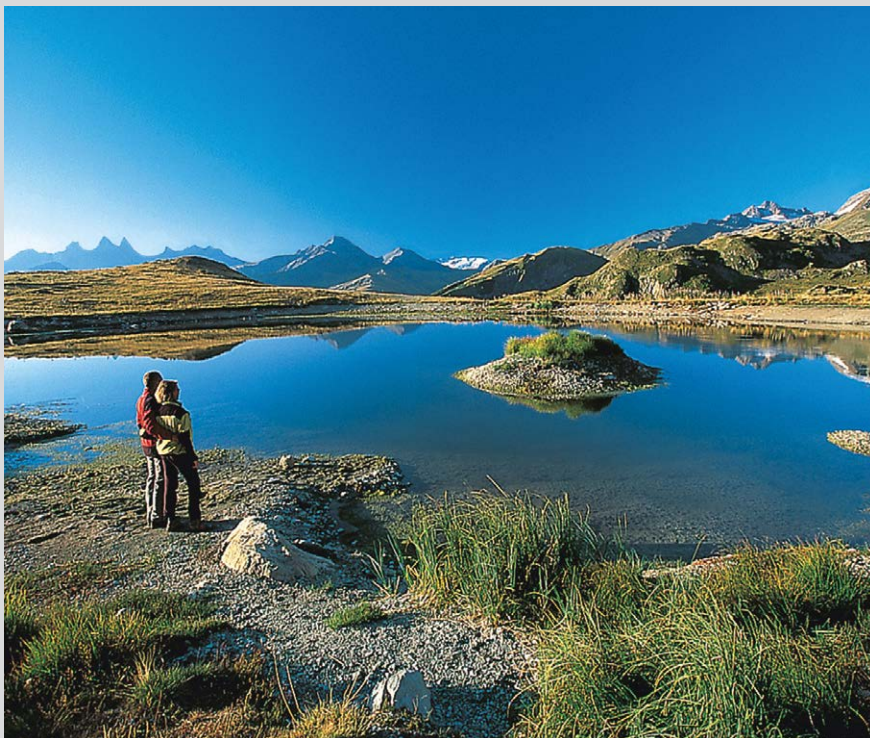
Le Laitet au Col de la Croix de Fer.

Du Col de la Croix de Fer ①, 2067 m, descendez de quelques mètres la piste carrossable en face du chalet jusqu'à la bifurcation et tournez à droite vers l'ouest. La piste oblique ensuite vers le sud dans une vallée d'altitude et s'étire en décrivant de nombreux lacets sur la façade ouest des Perrons sur une petite terrasse, puis descend vers le Refuge de l'Etendard ②, 2430 m, désormais visible. Longez la berge ouest du Lac Bramant et du Lac Blanc. Derrière le deuxième lac, le sentier passe de l'autre côté de la vallée. Continuez vers le sud à travers un terrain de moraines vers le début du Glacier de St-Sorlin ③, 2715 m.