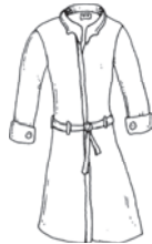
der Mantel die Mäntel coat / معطف