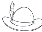
der Hut die Hüte hat / قبعة