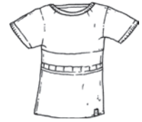
das T-Shirt die T-Shirts T-shirt / تيشرت