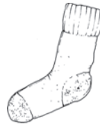
die Socke die Socken sock / جورب