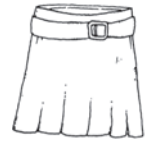
der Rock die Röcke skirt / تنورة