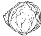
der Salat die Salate lettuce / خس