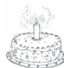
der Kuchen die Kuchen cake / كعكة