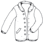
die Jacke die Jacken jacket / جاكيت