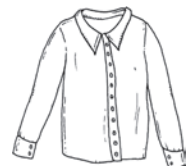
das Hemd die Hemden shirt / قميص