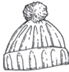
die Mütze die Mützen cap / قلنسوة