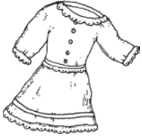
das Kleid die Kleider dress / ثوب