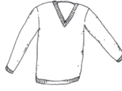
der Pullover die Pullover sweater / pullover / بلوفر