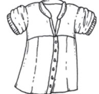
die Bluse die Blusen blouse / بلوزة