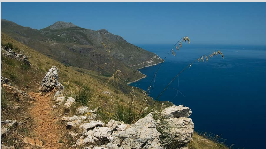
Vue du Pizzo del Corvo en direction de l'entrée nord du parc.

caillouteux (2) et pénétrez dans le parc sur la droite. Le large chemin sinue bientôt à plat, côtoie des oliviers, et arrive à une intersection devant un bâtiment ; ici les panneaux en bois indiquent à gauche la suite du parcours par les « Sentieri alti ». Ignorez peu après un chemin qui monte à gauche et poursuivez tout droit par le petit sentier (suivez toujours « Pizzo del Corvo, Sughero, Borgo Cusenza »). Continuez également tout droit à même altitude (« Sughero, Borgo Cusenza ») à la bifurcation à gauche suivante. Puis le sentier recommence à monter, le terrain devient plus abrupt et vous franchissez une crête rocheuse qui se termine au niveau du ressaut rocheux du Pizzo del Corvo (3) sur votre droite en contrebas. Le chemin descend ensuite en quelques vives. Vous traversez une combe qui dégringole le versant et évoluez bientôt parmi des herbes aussi hautes que vous et des palmiers. Après un autre vallon vous atteignez les maisons en ruine délabrées de Sughero (4) . Ignorez une bifurcation, gardez le cap tout droit direction « Cala Marinella, Borgo Cusenza », et à la bifurcation à droite suivante continuez de nouveau tout droit (« Borgo Cusenza »). Le sentier sinue à plat à flanc et, bientôt, au-dessus d'une maison, s'éloigne de la côte pour monter doucement sur la gauche.