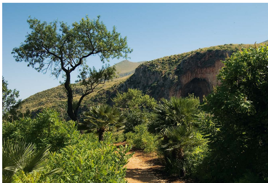
La grande caverne Grotta dell'Uzzo.

« Ingresso Nord ». Le chemin vous conduit dans la grande combe le long de parois rocheuses verticales et descend abruptement vers la mer. Une fois l'entrée nord et une baie à portée de main le chemin oblique à droite vers le sud. Vous croisez le chemin de liaison (7) entre les entrées nord et sud un peu plus bas. Empruntez le chemin joliment bordé de pierres vers la droite, face à vous la vue s'ouvre sur la Grotta dell'Uzzo , une immense caverne dans une paroi rocheuse. Au milieu de la verte végétation luxuriante vous atteignez avant la grotte le Museo della Civiltà Contadina (8) (là un sentier mène à gauche à l'une des plus jolies baies du parc du Zingaro). Visitez la grotte et poursuivez en direction de l'entrée sud. À la bifurcation à droite direction « Località Sughero » continuez à descendre doucement tout droit. À la Cala Marinella une autre baie vous appelle à gauche en contrebas. Poursuivez toujours tout droit sur le chemin le long de la côte rocheuse et passez entre quelques palmiers au-dessus des habitations de la Cala della Disa . Peu après, vous franchissez une porte en bois et arrivez à l'issue d'une côte raide au point de vue de la Punta Leone (9) ; continuez ensuite par un versant exposé aux chutes de pierres jusqu'au Museo della Manna (Cala del Varo). Le sentier perd de la hauteur et vous rejoignez l'intersection en contrebas du Centro Visitatori déjà croisé à l'aller. Retournez au parking par le tunnel de l'entrée sud (1).