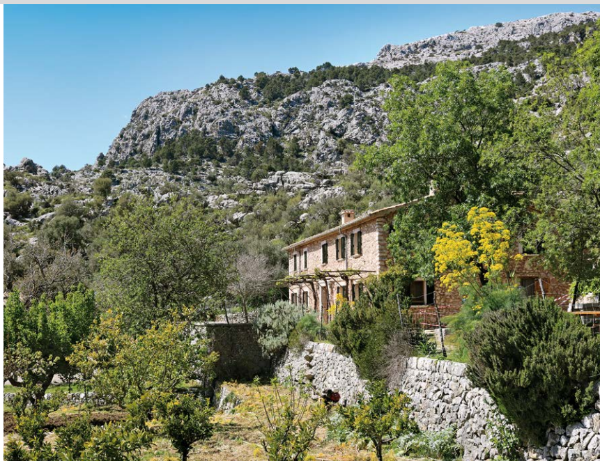
El refugio, al pie del macizo de Tossals Verds.

Un cable protege un tramo rocoso en el Pas Llis.