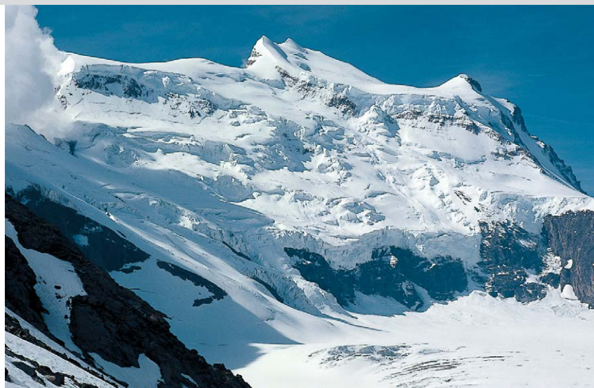
Pareil à une montagne de l'Antarctique : le Grand Combin depuis le Col des Otanes.

tout en haut, la vue sur le lac de retenue et la vallée environnante est très belle. Puis par une côte ascendante, on rejoint le cirque Les Tsantons. On franchit alors plusieurs ruisseaux avant d'arriver à l' Alpe Tseumette (2) , 2297 m. Le chemin serpente ensuite à travers les coteaux pentus parsemés de rochers jusqu'à la dépression suivante (3) qui descend du col. Après des roches moutonnées, on parvient de l'autre côté de la dépression où le chemin continue presque en ligne droite direction sud-ouest à travers des éboulis, parfois de la neige tassée, vers le vaste Col des Otanes (4) . Le chemin traverse ensuite les champs de pierres et de neige sous le minuscule glacier des Otanes jusqu'à un autre léger ensellement à 2880 m d'altitude (5) , d'où l'on peut contempler un beau panorama sur le cirque glaciaire de Corbassière. La descente depuis la selle jusqu'à la Cabane de Panossière (6) mène avec quelques virages sur un chemin bien aménagé à la moraine puis au refuge environ 500 m plus loin à droite (vers l'aval du glacier). – Le retour se fait par le même chemin.