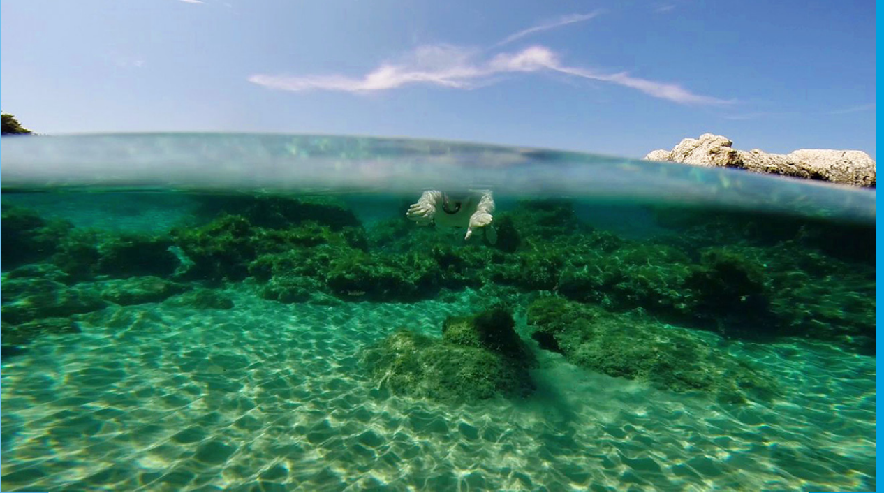
Abb. 1-1: Lass uns am besten gleich in die Welt der GoPro-Videoerstellung eintauchen ...

sich den Funktionen und Einstellungen der Kamera. Vielleicht hast du an dieser Stelle aber sogar schon festgestellt, dass dieses Bedienungsanleitungskapitel gar nicht das wichtigste ist. Tatsächlich haben die drei anderen Kapitel einen viel größeren Einfluss auf das Endergebnis deines Videos.