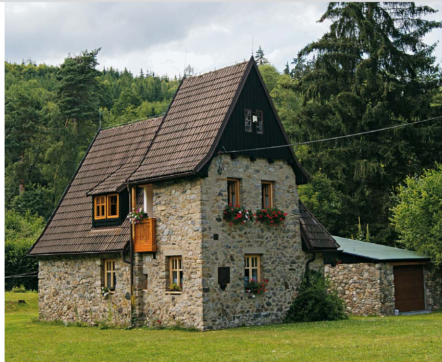
Ein untypisches Böhmerwaldhaus am Weg von Rejštejn nach St. Maurenzen.

weg 2108 zweigt hier links auf eine unbefestigte Trasse in Richtung Wald ab. Nach Passieren des Walds wird unser Weg immer schmaler, rechts erscheint auf dem Hügel Hartmanice. In weitem Bogen wendet sich der Weg nach links und läuft nun nach Kundratice (7, Kundratitz) hinein. In der Dorfmitte gibt es rechts eine sehr urwüchsige Einkehrmöglichkeit. Hier gehen wir nun auf der Asphaltstraße mit der blauen Markierung nach links und kommen am gut erhaltenen Gutshaus vorbei. Dann geht es bergauf und bergab über Štěpanice hinauf in das fast völlig verlassene Zálužice (8,