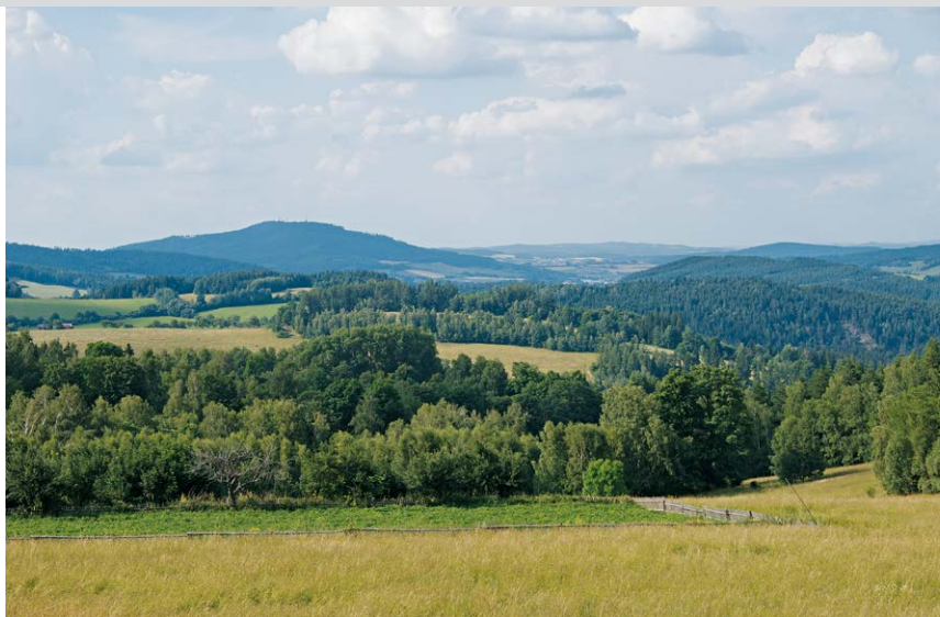
Zauberhafte Natur umfängt uns auf den Höhen um Velký Radkov.

Vom Ausgangspunkt am Ortsrand von Rejštejn (1) gehen wir zur Ortsmitte und an der alten Volksschule auf einem rot markierten Weg über die Otava in den Ortsteil Klášterský Mlýn, vorbei an einem schönen alten Böhmerwaldhaus und der Jugendstilvilla des Fabrikanten Spaun. Beim ehemaligen Gasthof Lötz (2) , der seit einiger Zeit geschlossen ist, mündet von links unserer späterer Rückweg ein. Entlang der Otava passieren wir hübsche Badestellen und kommen nach etwa 1,5 km zum Abzweig (3) nach Radešov (Schröbersdorf). Wir gehen 150 m in dieser Richtung bis zum Ortsanfang –