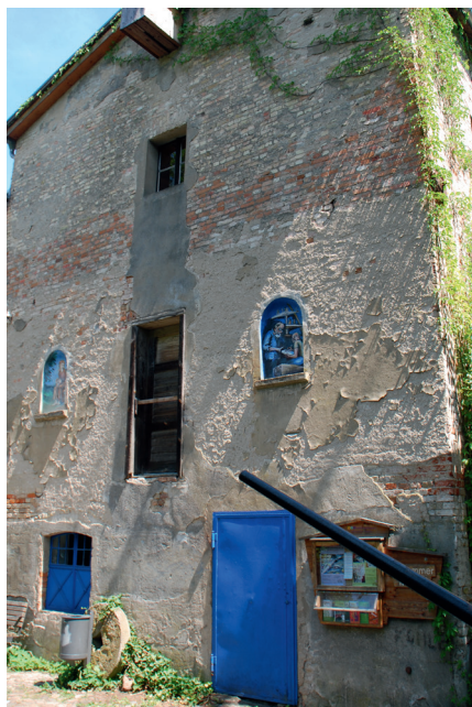
S. 22, oben: Schutzhütte; unten: Wassermühle