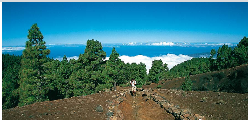
Ascensión a la cresta de la Cumbre Vieja.

Desde la carretera atravesamos la zona recreativa hasta el Refugio del Pilar y, en la bifurcación 50 m después del centro de visitantes (exposición interesante sobre la Cumbre Vieja), seguimos en dirección a «Los Canarios» (GR 131, blanco-rojo). A los 10 min, en la bifurcación, nos desviamos otra vez a la derecha. Al principio el sendero discurre por un pinar maravilloso; más tarde se abre a la vista el marco de montañas de la Caldera de Taburiente y del valle de Aridane. Cruzamos la ladera de grava volcánica del Pico Birigoyo; solo los helechos, la retama y los pinos ofrecen un contraste al paisaje caracterizado por la arena negra. Al cabo de un total de 40 min, el sendero se incorpora a una pista forestal por la que continuamos subiendo a mano izquierda. 15 min más tarde —nos encontramos otra vez en un pinar poco frondoso— el GR 131 se desvía a la derecha, para continuar por un camino que discurre por un paraje precioso, que la naturaleza parece haber