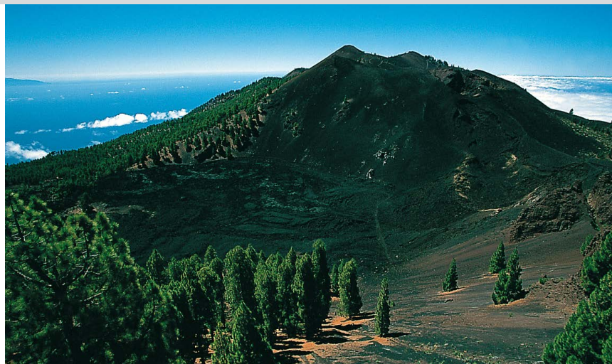
La colada de lava de La Malforada con la Montaña del Fraile.

Siguiendo por la Ruta de los Volcanes, enseguida aparece el próximo cráter con la colada La Malforada, negra como el carbón. El camino discurre bordeando el cráter por la derecha y se bifurca en el punto más bajo del borde del cráter al pie de la Montaña del Fraile (¼ h). De frente se desvía un sendero hacia la cumbre principal de la Deseada, 1945 m (el sendero se acerca al cráter del Duraznero; al final continuamos a la izquierda); pero nosotros seguimos a mano derecha por el camino señalizado. Primero descendiendo levemente y rodea el Duraznero ampliamente, discurre por un valle, que va empinándose hasta llegar a la cumbre de la Deseada II , 1932 m (½ h). Nuestros esfuerzos