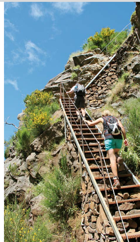
Un escalier raide monte jusqu'à l'arête.

Après la fontaine et les WC, la dernière étape vers le sommet culminant de l'île commence. À la bifurcation 5 min plus tard, gardez votre gauche pour vous retrouver, après une courte montée escarpée, à la colonne sur le sommet du Pico Ruivo (7) , 1862 m. Les vues depuis le point culminant de Madère sont grandioses et on ne sait pas dans quelle direction regarder une fois en haut. Le panorama vers l'ouest jusqu'aux éoliennes sur le plateau Paul da Serra notamment est particulièrement beau – toujours à condition qu'il ne disparaisse pas sous une couche de nuages. Après avoir pleinement profité du spectacle, reprenez le même chemin pour retourner à votre point de départ au Pico do Arieiro (1) .