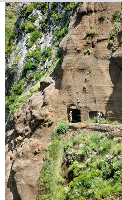
À l'entrée du tunnel devant la troisième tour rocheuse.

Une courte remontée via une arête rocheuse spectaculaire et la descente ensuite sur un chemin aérien, mais très bien sécurisé par une corde, vous mène vers Pedra Rija . Descendez en direction du tunnel du Pico do Gato (3) , 1600 m, par un passage très raide sécurisé avec des câbles métalliques. 3 min après le tunnel de 50 m de long, le chemin se divise. La route orientale autour du Pico das Torres commence à droite, la route occidentale qui passe par le « chemin des tunnels » à gauche. Les deux itinéraires sont indiqués avec l'inscription Pico Ruivo. Continuez à gauche sur la route occidentale (PR 1 Pico Ruivo O, 3,4 km). Le sentier creusé dans la paroi s'étire aussitôt de manière spectaculaire vers un cirque rocheux en demi-cercle et rejoint en 4 minutes un tunnel de quelque 100 m de long et extrêmement sombre sur les premiers mètres à cause d'un coude. Peu après, le chemin s'étire dans un tunnel dominé par deux hautes tours rocheuses. Même si c'est le plus long du parcours (200 m), on peut voir la fameuse lumière au bout du tunnel dès qu'on y entre ; il peut être par endroits un peu humide selon la saison. À peine sorti, il faut à nouveau traverser deux courts tunnels de 10 m de long chacun.