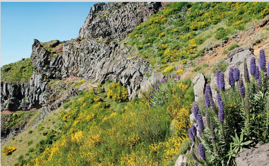
Printemps en montagne : le violet des vipérines ( Echium candicans ) contraste avec le jaune des ajoncs.