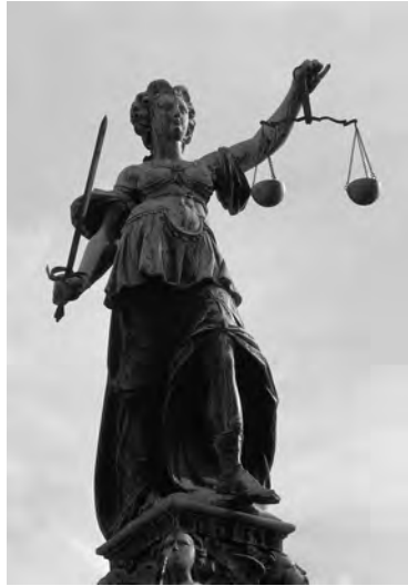
Justitia, Standbild in Frankfurt

Gerecht handeln, bedeutet, alle Menschen gleich zu behandeln.