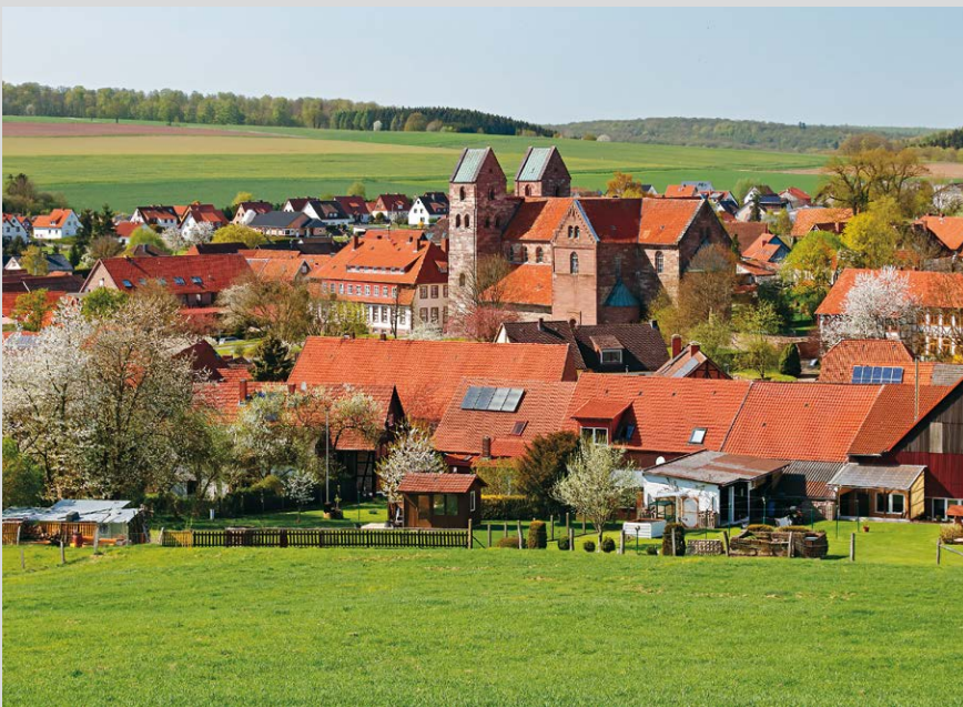
Am Nordende der Weper empfängt uns der Zielort Fredelsloh.

Gehölz über einige Stufen bergauf in ein weiteres Wohngebiet von Hardeggen (An der Niedeck) und unweit des Bahnhofs über die Gleise. Unmittelbar dahinter achten wir auf den kleinen Pfad nach links in den Wald und schneiden damit die Schleife der Trögener Landstraße ab. Diese wird später gen Osten gekreuzt, womit wir zum Weperkamm (3) , ca. 290 m, aufschließen. Der schmale Pfad führt sogleich an einem gewaltigen Steinbruch vorbei und