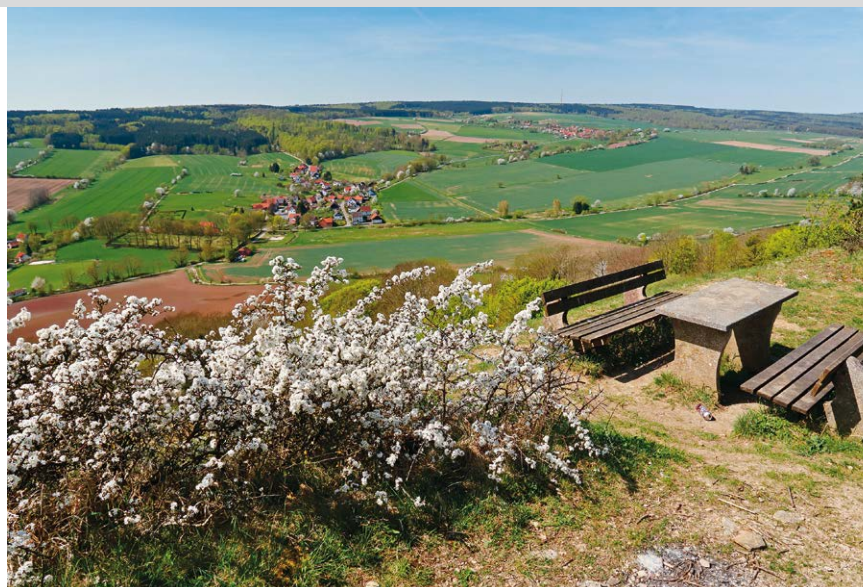
Am Balos haben wir den Kulminationspunkt der Weper erreicht.

cherheit vorteilhaft, zudem ein guter Orientierungssinn, denn die Beschilderung ist oft mangelhaft. Konditionell durchschnittlich.