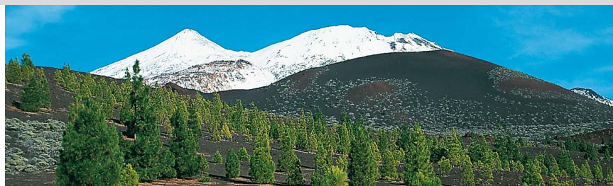
Au départ de la randonnée – la Montaña de la Botija avec le Pico Viejo et le Pico de Teide.

Depuis le mirador (1) , nous suivons le chemin bien visible qui se divise après 30 m à un poteau indicateur – nous tournons ici à droite dans l'itinéraire 32 qui conduit direction est vers le Teide. Le chemin sablonneux est à peu près parallèle à la route et passe au bout de 5 min à gauche d'un pluviomètre. 100 m plus loin, on ignore un sentier qui bifurque à gauche. Quelques minutes plus