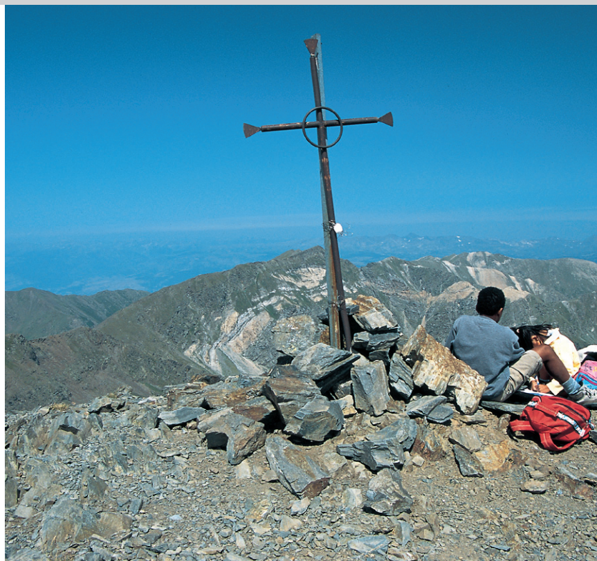
En el Pic de Noufonts.

Regreso por el valle de Eina. En el Pic de Noufonts, junto al símbolo CEF de hierro forjado, tomamos el camino de la cresta que baja en dirección al Pic d'Eina. Este pasa el pequeño collado (2.734 m) desde el que se alza hacia el norte el Pic d'Eina sin perfil, prosigue durante un rato más o menos llano y a continuación baja por un terreno pedregoso hasta el ancho Coll d'Eina , 2.684 m, con vistas del valle d'Eyne francés. Desde el collado torcemos hacia la falda sureste del Puig del Coll d'Eina siguiendo los hitos y las marcas azules. El camino desciende rápidamente por la ladera, que primero presenta un terreno pedregoso y luego hierba, y se transforma en curvas que llegan relativamente cerca al final del valle, junto al arroyo. Lo cruzamos y caminamos por la parte izquierda del camino batido en dirección a la salida del valle hasta el puente antes de Núria. Desnivel a partir del Coll de Noufonts: ascenso 210 m, descenso 900 m. Duración desde el Coll de Noufonts: 3½ h.