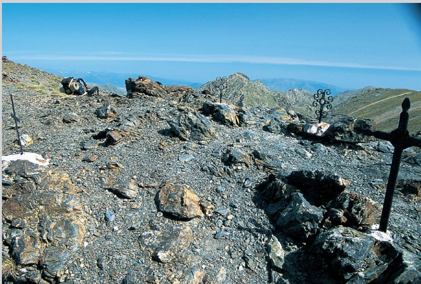
Coll de Noucreus: puerto de las «nueve cruces».

dor del camino (2.180 m), situado a la derecha y un poco más alto, donde proseguimos en dirección «Nocreus». Nuestro regreso se realiza por el GR-11 que se desvía aquí. Ahora caminamos con una cómoda pendiente por laderas con hierba y sin árboles en dirección hacia el valle. De vez en cuando, el valle con pastos nos muestra, con las laderas parcialmente erosionadas, un sencillo aspecto y pocos puntos de referencia. En el ondulado final del valle el camino empieza a subir y a continuación traza curvas abiertas que ascienden por la pedregosa falda del collado. Por debajo de la cresta rocosa cruzamos a la izquierda hasta el llano Coll de Noucreus , 2.795 m. Este puerto con magníficas vistas está decorado con nueve cruces. Tomamos el GR-11 hacia el oeste por la loma de la cresta. Este pasa por delante del poco vistoso Pic de Noucreus , 2.799 m, y luego baja rápidamente hasta el Coll de Noufonts , 2.651 m, en el que hay un refugio de piedra. Aquí (véanse las variantes) dejamos la cresta limitrofe y seguimos por el GR-11 que baja a la izquierda por las empinadas laderas. A partir de la fuente «Nou Fonts», a la derecha del camino, la pendiente disminuye considerablemente y acompañamos al Torrent de Noufonts, que atraviesa el valle de forma pintoresca. Después de unas curvas abiertas del camino, a la altura del pequeño puente volvemos a encontrarnos con el camino de ida, por el que regresamos a Núria .