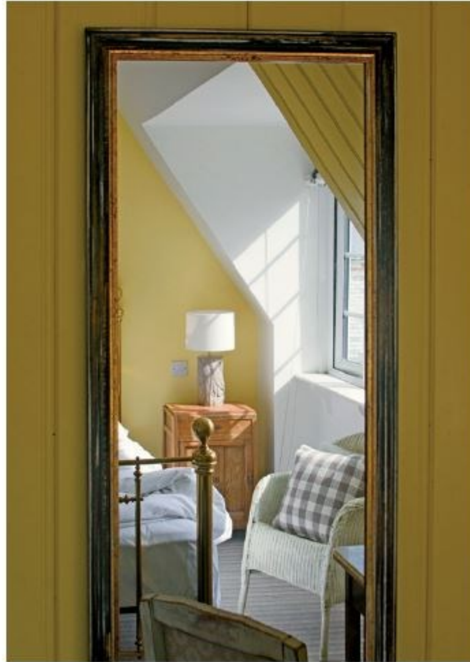
Genug jetzt erst einmal von Kathedralen, Schlössern und Ruinen! Bevor es jetzt endlich ans Meer geht, zu wilden Klippen, weiten Stränden und romantischen Fischer- und Badeorten, bietet sich in dem winzigen Dorf West Lulworth in dem kleinen Hotel Lulworth Cove Inn ein traumhaftes