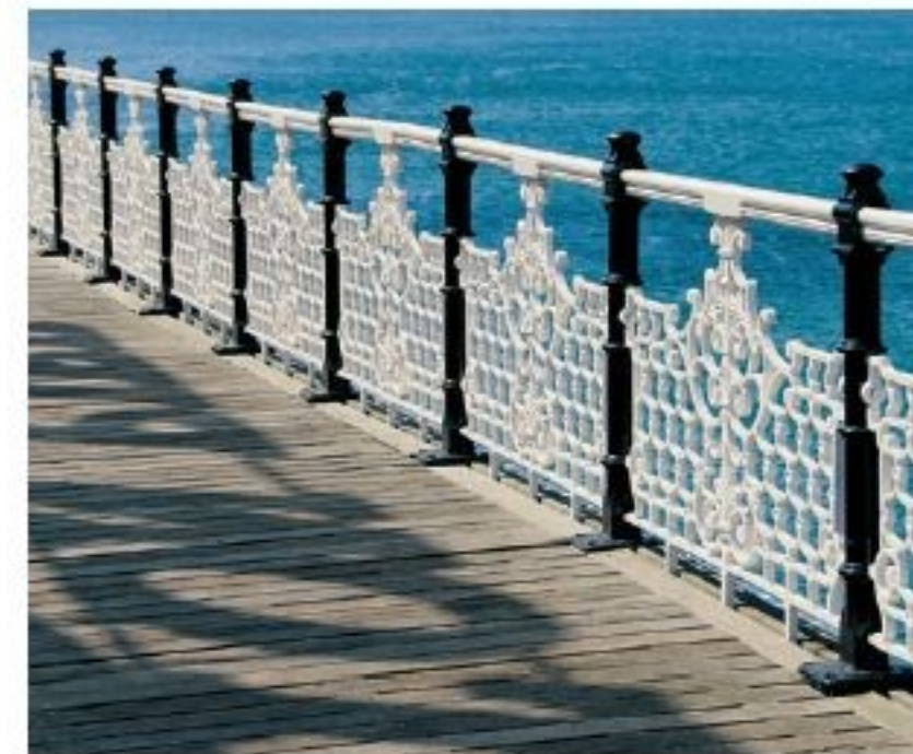
OBEN — Das Palace Pier mit dem Charme längst vergangener Zeit ist das bekannteste Wahrzeichen von Brighton.

Schottland, nur Wales oder einfach nur Cornwall und der Süden. Nach unserem Studium waren wir dann im Rahmen unserer Tätigkeit als Reisefotografen natür-