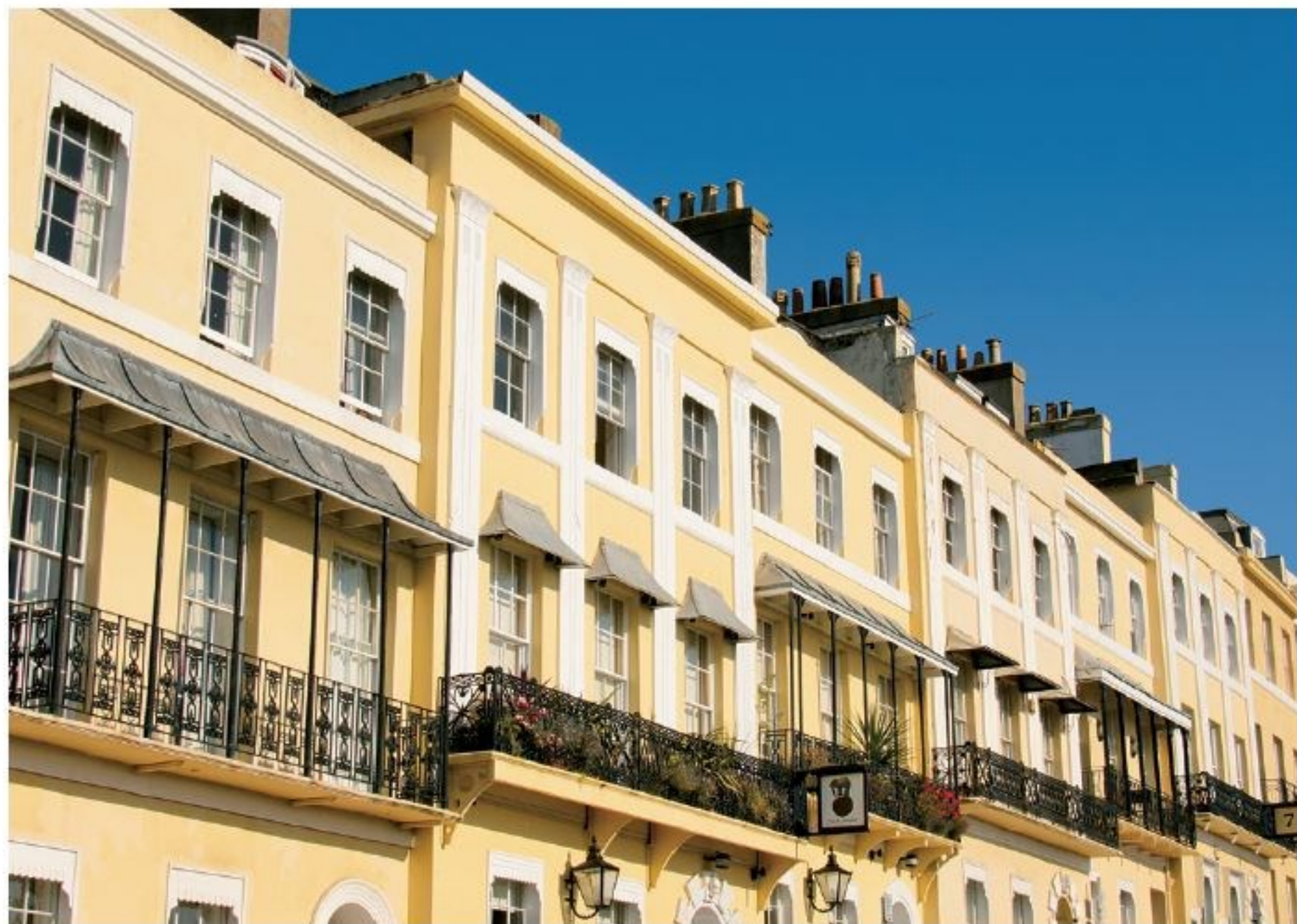
Sonnengelb vor Blau, elegant und strahlend – noble Stadthäuser an der Victoria Parade in Torquay. Wer möchte nicht von einem dieser filigranen Balkone auf die Bucht schauen? Krimiautorin Agatha Christie verbrachte hier in der Region ihr ganzes Leben, von ihren zahlreichen Reisen einmal abgesehen.