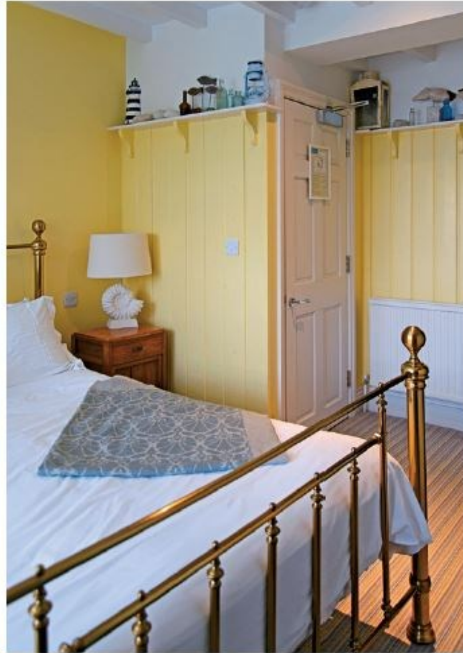
Übernachtungsplätzchen in idealer Lage: hübsch möblierte und liebevoll im maritimen Stil ausgestattete Zimmer mit Meerblick, leckeres Frühstück im fantasievoll dekorierten Restaurant und ein toller abendlicher Spaziergang ans Meer. Braucht man mehr?