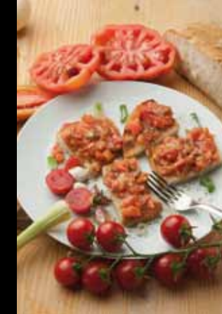
Crostini con l'aringa