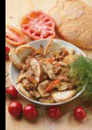
Zuppa di funghi porcini