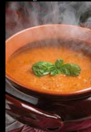
Pappa al pomodoro