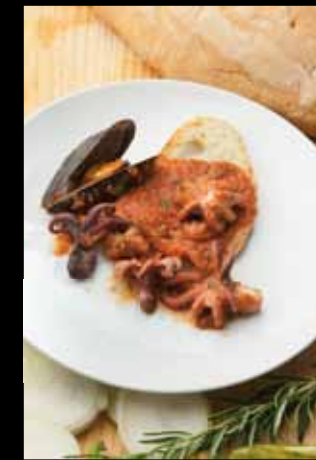
Crostini con moscardini