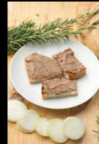
Crostini con fegatini