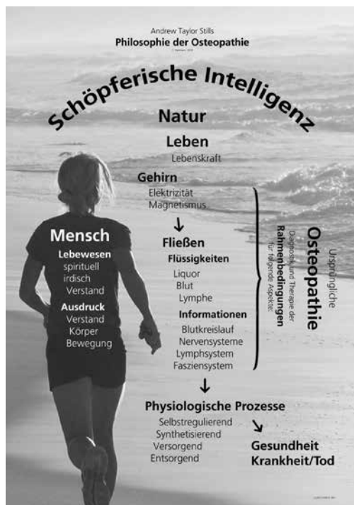
Abb. D: Andrew Taylor Stills Philosophie der Osteopathie.

Insbesondere aufgrund der perfekten Abläufe selbstorganisierender Kräfte innerhalb der belebten Natur schließt Still auf einen intelligenten Schöpfer, der wie ein Ingenieur wirkt. Still interessiert sich dabei nicht so sehr für diese schöpferische Entität selbst als vielmehr für dessen schöpferische Intelligenz . Diese hält er für absolut und wohlwollend.