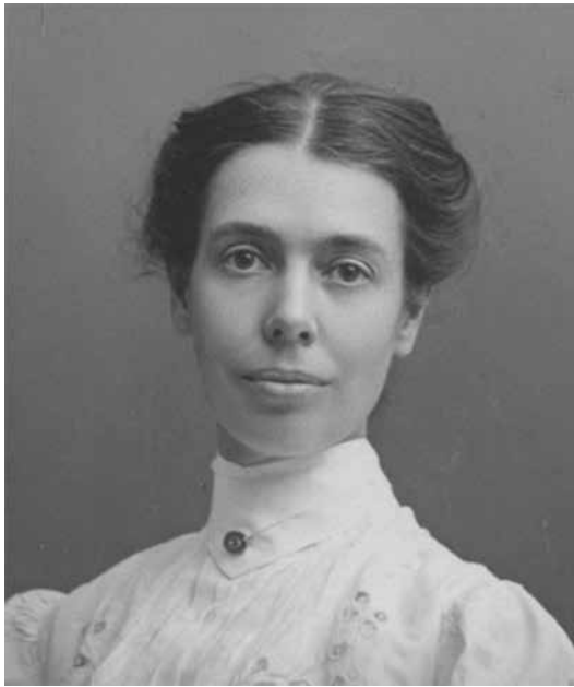
Abb. A: Louisa Burns MS, DO, DScO 1869–1958

„Uns, die wir durch die Jahre stolpern, erscheint diese einfache wesentliche Tatsache: das Leben weise nutzen, nicht nur atmen, erweckt die Freude zum Leben und ehrt dereinst den Tod.“ 1