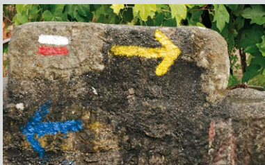
La flèche jaune indique Saint-Jacques-de-Compostelle, la bleue Fatima.