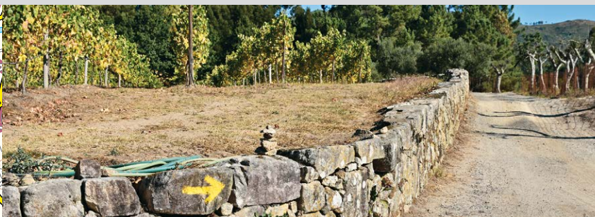
Vignes près de l'hôtel de campagne Estábulo de Valinhas.

puis monter à gauche derrière le bâtiment aux grandes fenêtres pour rejoindre le gîte).