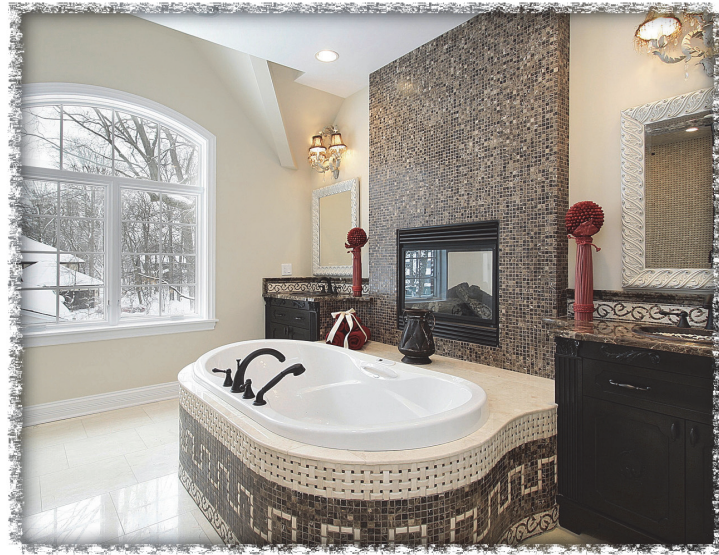
The bathroom Das Badezimmer