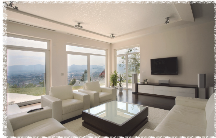
The hall Der Saal