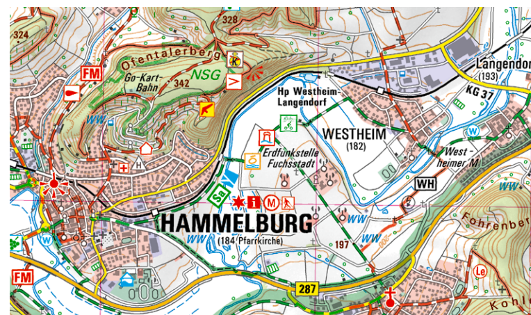
Ausschnitt aus UK50-1 Naturpark Bayerische Rhön

Und auch die Bäder der Rhön sind berühmt: in Bad Kissingen kurten bereits Kaiser und Könige. Bad Bocklet, Bad Brückenau und Bad Neustadt a.d.Saale brachten es zwar nicht zu einer solchen Prominenz, aber auch ihre Heilwässer zeichnen sich durch vorzügliche Heil-Eigenschaften aus.