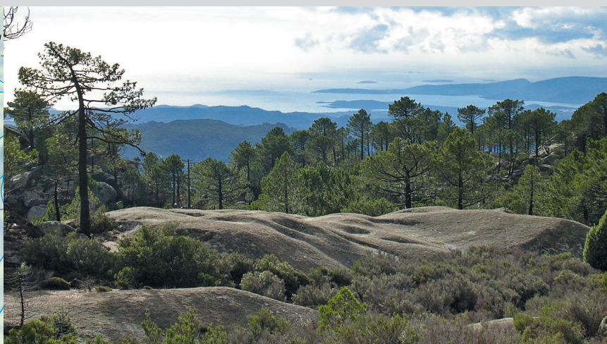
Blick von der Bocca di u Sordu zum Meer.

Durchtritt sieht man das Ziel unter sich liegen: Conca! Wer noch heile Füße und Knie hat, kommt schnell zur Quelle , 370 m, oberhalb des Ortes, und – war es Absicht? – der Ortsteil, in dem man landet, heißt » Radicale « (7) – so könnte man auch die Korsikatour über den GR 20 nennen.