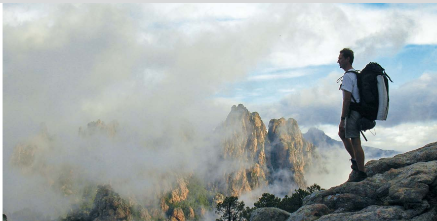
Bocca di Monte Bracciatu.

Vom Refuge de Paliri (1) , 1055 m, führt der Weg in südöstliche Richtung. Langsam steigt man hinunter, kommt an der Bocca di Monte Bracciatu (2) , 953 m, vorbei, und es geht weiter bergab, bis auf die Höhe von 920 m, dabei macht man einen Bogen um die Punta di Monte Sordu, 1117 m. Leider ist auch hier ein großer Teil des schattigen Pinienwaldes durch Feuer vernichtet worden. Am Nachmittag steht bei Sonnenschein über diesem Abschnitt eine brütende Hitze, während noch vor ein paar Jahren die Wanderung durch den Schatten des Waldes führte. Achtung: Man muss hier gut auf die Zeichen achten, sie führen nach rechts, in südliche Richtung, wieder bergauf. Wer die Markierungen übersieht und auf dem unmarkierten Pfad den Aufstieg zur Bocca di u Sordu (3) , 1065 m, verpasst, muss zurück. Nach der Bocca bleibt die Grundrichtung weiter Südosten. Es geht ein Stück über die Felsen. Wer in diesem Bereich von Süden kommt und nicht aufpasst, verpasst auch schnell den Punkt, an dem die Zeichen nach rechts über den Fels zur Bocca di u Sordu führen.