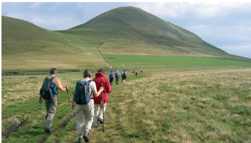
Groupe de randonneurs entre les puys du Massif du Sancy.

Descendez ensuite le long d'un cours d'eau jusqu'à ce qu'un sentier quitte la route au bout d'environ 15 mn sur la droite et vous conduise à la Cascade du Rossignolet (8) , par laquelle vous faites un petit tour. La cascade semble se poser comme un voile autour de la roche volcanique entre les arbres hauts. De retour au chemin principal, un chemin bifurque bientôt à gauche vers la Cascade du Queureuilh (9) . Une masse d'eau tonitruante déferle dans cet endroit magique sur les orgues basaltiques inclinées. Depuis la belle cascade rugissante, suivez le panneau direction Le Mont-Dore et le balisage blanc-rouge du GR 4E sur la droite. Le chemin de randonnée débouche sur une route asphaltée escarpée et rejoint près de Prends-toi-Garde les abords du village du Mont-Dore. Continuez tout droit par la route nationale qui monte doucement à gauche jusqu'à votre point de départ à l'office du tourisme du Mont-Dore (1) .