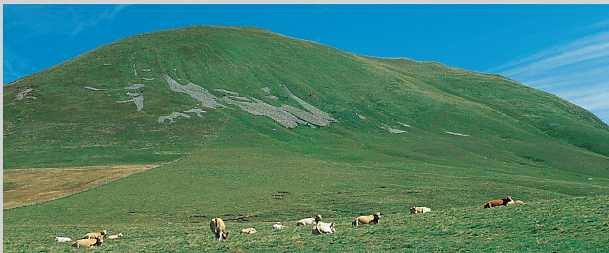
Vaches en train de brouter sur les estives en altitude.

pouvez reconnaître le Col de la Croix St-Robert ainsi que le Puy de l'Angle devant vous. Juste en dessous du Col de la Croix St-Robert (1451 m), vous retracez la D 36. De l'autre côté de la route, un chemin à travers champs s'étire entre et sur des pâturages à moutons tout droit en montant sur un épaulement. Continuez à monter, franchissez une clôture puis bifurquez juste après à droite dans la direction indiquée par le balisage vert jusqu'au Puy de l'Angle. L'ascension est relativement escarpée au départ, mais le terrain s'aplanit ensuite et vous mène en serpentant jusqu'au point culminant de votre randonnée, le Puy de l'Angle (3 ; 1738 m) .