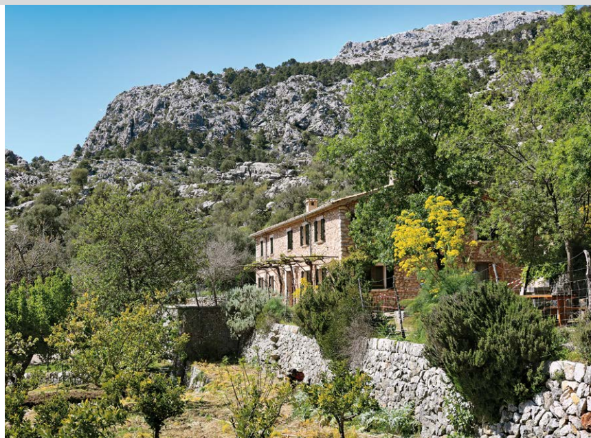
Le refuge au pied du massif de Tossals Verds.

Un passage rocheux est sécurisé par une chaîne sur le Pas Llis.