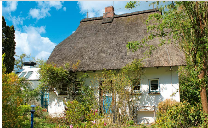
Reetdachhaus in Niederkleveez (oben); Infotafel am Beginn vom Naturlehrpfad (unten).

Vom Bahnhof Eutin 1 startet unsere Tour nordwestwärts durch die Bahnhofstraße bis zu deren Einmündung in die Plöner Straße. Dort gehen wir nach links über die Eisenbahnbrücke und nach der Umfahrungsstraße rechts in die Waldstraße. An deren Ende halb rechts zu einer Brücke über die Umfahrungsstraße und Eisenbahnstrecke. Vor der Brücke nach links,