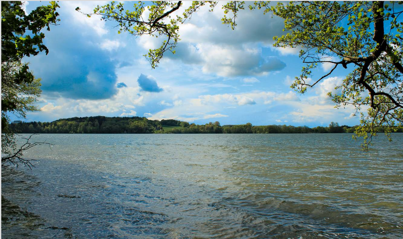
Blick über den Behler See.

folgen wir kurz nach rechts zum Waldrand mit Parkplatz. Von dort führt unsere Route links bzw. westwärts auf breitem Waldweg in das Beuthiner Holz , vorbei an verschiedenen Abzweigungen nach links, die wir ignorieren. Entsprechend dem Hinweisschild »Dieksee 2,7 km« geht es weiter, an einem idyllischen kleinen Waldsee vorbei, kurz danach bei einer Gabelung rechts ab Richtung Grillplatz (Wege 8 und 9) und zunächst geradeaus. Bei einer weiteren Weggabelung halten wir uns links (Hinweis »Rachut 0,5 km«) und wandern auf dem Viertweg bis zum Waldrand. Kurz danach mündet von links die Straße Am Walde ein. Sie führt geradeaus als Rachuter Straße weiter. Auf ihr kommen wir kurz danach zum rechts liegenden Waldparkplatz und Grillplatz von Rachut ② mit vielen Rastmöglichkeiten. Weiter in bisheriger Richtung, an Häusern vorbei, auf der Rachuter Straße zur Plöner Straße (L 56; dort Bushaltestelle), die rechter Hand nach Malente führt. Wir wandern nach deren Überquerung geradeaus auf dem Holmweg