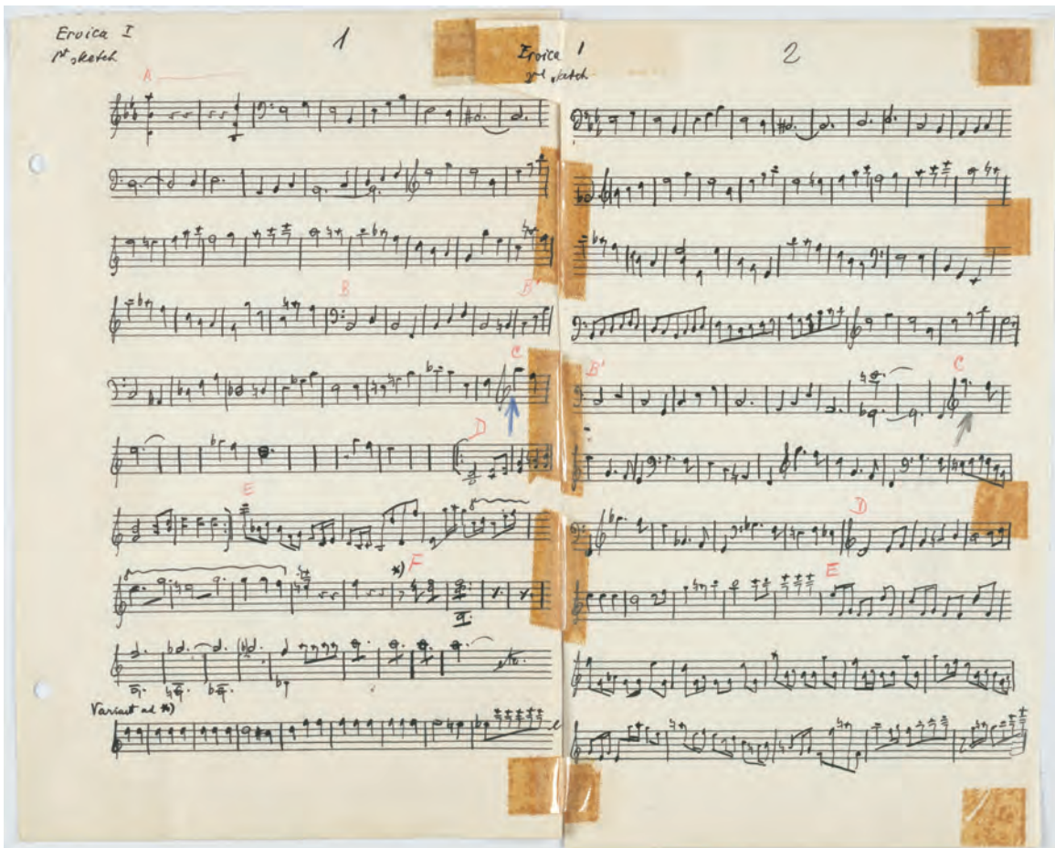
ABBILDUNG 2 Ernst Krenek: Eroica-Skizzen, Blatt 1 und 2

ten Skizzen zur Exposition und zur Durchführung des Eroica -Kopfsatzes. Hier sind die Noten sorgfältiger mit schwarzer Tinte geschrieben 19 und haben rote und blaue Markierungen (Abbildung 2).