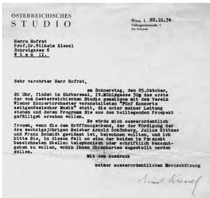
ABBILDUNG 1 Brief von Ernst Krenek an Wilhelm Kienzl vom 22. Oktober 1934 (Wienbibliothek im Rathaus, Handschriftenabteilung, IN 179440)

gen Österreich zugrunde liegt«. Eine »laue Kompromisshaltung« sei das letzte, worauf eine solche Bestrebung ziele: Traditionalisten und »Radikale« sollten vielmehr »verstehen, wieso sie gleichzeitig da sind und zusammengehören« – und zwar unter der Maßgabe der Qualitätsmerkmale »guter Musik«. Die »kulturelle Aufgabe, die Österreich heute zugefallen ist«, so spitzt Kreneks Ansprache zu, bestehe darin, »einen wesentlichen Beitrag zur Kontinuität der europäischen Geisteskultur zu leisten, indem wir einen Ausweg aus der fast überall seit Jahren festgefahrenen Vorurteilslast der neuen Kunst zu zeigen versuchen«. 25 Kreneks Plan war es mithin, »Programme an[zu]bieten, die spezifisch österreichische Entwicklungen in der modernen Musik aufzeigen sollten, und in diese Programme auch Vertreter der sogenannten konservativen Gruppe mit einbeziehen, nicht so sehr, um sie zu beschwichtigen, sondern vielmehr, um sie vorzuführen«: indem er »ihre besten Leistungen mit einigen der besten Produkte der »Radikalen« kombinierte und konfrontierte« und »die verschiedenen Werke durch sorgfältig vorbereitete Einführungsvorträge ins rechte Licht rückte«. 26