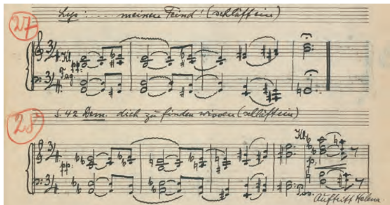
NOTENBEISPIEL 1 Zettel und die Handwerker, Nr. 5