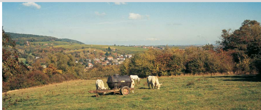
Idylle rurale à la périphérie de Wissembourg.

au balisage, plusieurs changements de direction). Par un sentier plaisant montant tout au plus de façon modérée, on arrive à la « Redoute 1708 » (modestes vestiges de la guerre), on traverse le grand fossé pour arriver enfin au sommet du Scherhol ③, 506 m (45 min). Hélas, aucun panorama ne nous attend ici, la tour d'observation de 14 m de haut qui avait été édifée en 1894 par le C. V. a été détruite en mars 1945. Quelques pas avant le Refuge du Scherhol (abri), construit en 1903, nous descendons à droite par un sentier à flanc menant rapidement au Col du Pigeonnier ④, 432 m, et au refuge du Club Vosgien où on rejoint la D 3 (10 min).