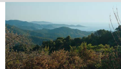
Vue depuis la Bocca di Catrusia sur le golfe d'Ajaccio au Sud-Ouest.

On suit la route à droite pendant 2,5 km. La D 302 passe par la Bocca di u Grecu (5) , 474 m, mais on bifurque à gauche avant d'y arriver. Une autre flèche orange apparaît sur l'asphalte. Le sentier par endroits érodé s'étire à travers le maquis sur la crête, vers le Sud-Est pour commencer, puis vers l'Est en direction du point culminant de cette région, la Punta Cozzaniciu (1059 m). À 740 m d'altitude, les repères de couleur orange s'éloignent de l'ancien chemin de berger direction Sud sur une pente ascendante un peu plus raide jusqu'à 952 m. Nous croisons un peu plus loin le Mare a Mare Centre (6) , 932 m, cf. p. 174/175). Le Mare e Monti Sud continue sur la droite, mais ne descend plus comme avant directement vers Bisinao. Il poursuit d'abord vers l'aval au Sud-Ouest, puis vers la vallée d'Anghione jusqu'à la D 302 (7) tout en bas. Prendre maintenant à droite, sur la route jusqu'à Bisinao (8) , 645 m. Le gîte, qui dispose d'une petite piscine, est à 1 km (fontaine et petit magasin juste avant d'y arriver). Si vous préférez continuer sans attendre, tournez à gauche dès l'entrée dans Bisinao.