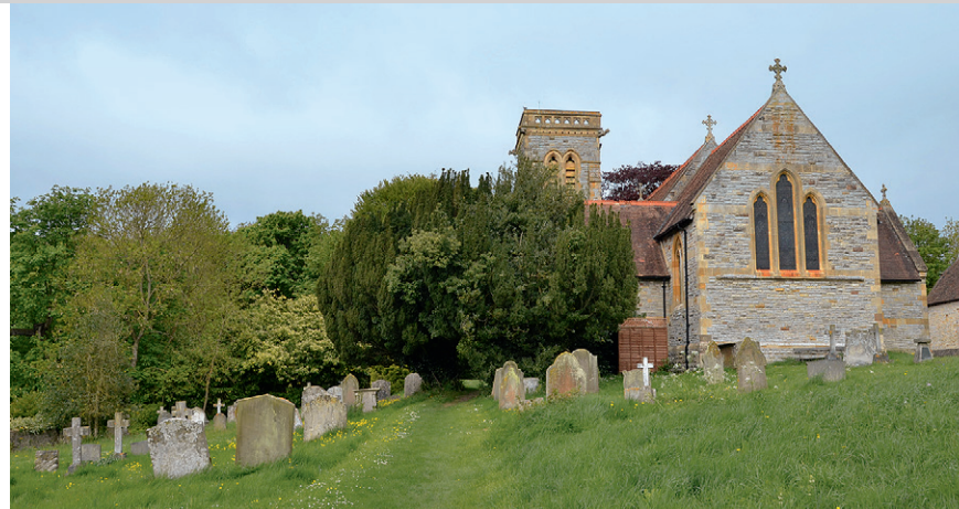
St Peter's Church in Lower Binton.