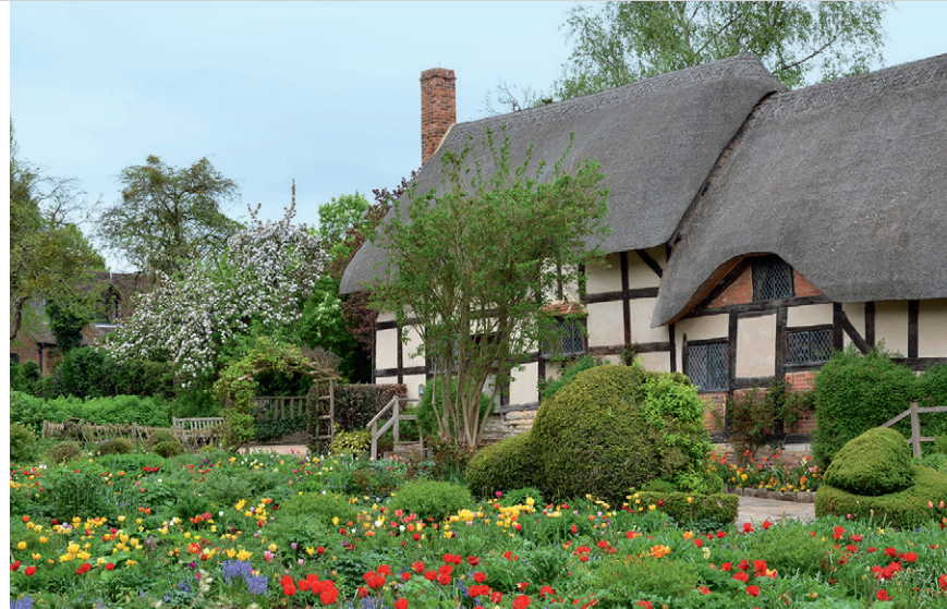
Anne Hathaway's Cottage.

Vom Ausgangspunkt in Stratford-upon-Avon (1) gehen wir in westlicher Richtung über die Brücke und biegen nach links in Richtung Royal Shakespeare Theatre ein. Nach rechts geht es dann auf der Chapel Lane zur Guild Chapel (2) und dort dann nach links auf der Church Street weiter. Bei der Stratford Preparatory School wandern wir nun nach rechts, wobei der Weg ab hier mit »Anne Hathaway's Cottage« ausgeschildert ist. Wir kommen am Evesham Place zu einer breiteren Straße, überqueren diese und gehen in einen Fußgängerdurchgang neben dem Woodstock Guest House (3) . In kurzer Folge kreuzen wir nun einen Fahrradweg und drei Wohnstraßen, bevor wir nach einer Parkanlage zu einer Gabelung gelangen, wo wir uns für den rechten Pfad entscheiden. Nach einem mit Reet gedeckten Haus kommen wir zu einer Einbahnstraße und zu einem kleinen Kreisverkehr, überqueren diesen und gehen in der bisherigen Marschrichtung weiter. Nach einer Rechtskurve erreichen wir Anne Hathaway's Cottage (4) , dessen Garten immer eine Augenweide ist.