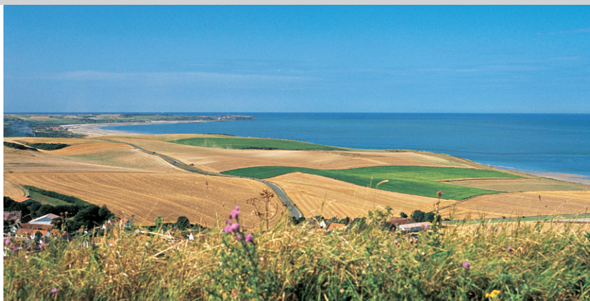
Le Mont d'Hubert : une « montagne » panoramique avec vue sur la Baie de Wissant.

Du parking dans Wissant (1) , prenez la rue (balisage blanc-rouge et marques jaunes) à droite de l'église qui traverse un pont. Directement après l'Hôtel de la Plage, prenez à gauche et à la prochaine bifurcation, à nouveau à gauche pour arriver juste après à une belle plage de sable. Continuez sur celle-ci à droite avec une belle vue au-dessous de la Dune d'Amont que vous longez jusqu'aux maisons de Strouanne (2) . Ici, une voie d'accès débouche sur la plage. Peu après, montez à droite par quelques marches de bois en haut de la rive élevée et suivez à gauche un chemin balisé en blanc-rouge qui monte doucement en suivant la côte. Comme auparavant, on a ici des vues magnifiques du Cap Gris Nez sur la Baie de Wissant et au Cap Blanc Nez et par beau temps, jusqu'à l'Angleterre. Après le Petit Blanc Nez (3) , le chemin descend légèrement avec toujours les impressionnantes falaises blanches du « grand frère » en face. Vous arrivez ainsi au parking de Cran d'Escalles (4) , à l'endroit où vous devez faire demi-tour. Il y a ici une friterie en saison (pour la montée au Cap Blanc Nez, voir l'itinéraire 7). Revenez par le même chemin avec maintenant la vue sur le Cap Gris Nez.