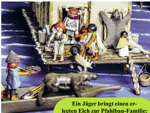
Ein Jäger bringt einen erlegten Elch zur Pfahlbau-Familie: Geschichte mit Playmobil im ALM

► Hier ist die Vergangenheit der Bodensee-Region für alle Altersstufen spannend, lebendig und verständlich aufbereitet. Auf 3 Stockwerke verteilt seht ihr steinzeitliche Pfahlbauten, alemannische Adelsgräber und das älteste Schiff des Bodensees. Um vorgeschichtliche Pfeilspitzen oder gar einen Sonnenhut aus Bast zu finden, muss Archäologie betrieben werden: das ist die Wissenschaft, die sich mit der kulturellen Entwicklung des Menschen seit seinem Erscheinen vor 3,3 Mio Jahren beschäftigt. Sicher gefallen euch im ALM die regelmäßigen Playmobil-Ausstellungen zu verschiedenen historischen Themen. Da wird z.B. das Leben im Pfahlbau-Dorf mit den kleinen Figuren nachgestellt. Ein stadthistorischer Saal informiert über Konstanz zwischen der Römerzeit und dem Konstanzer Konzil 1414 – 1418. Interessant ist auch die Abteilung zum Mittelalter. Welche Gegenstände man vor 1000 Jahren benutzte und welche Speisen die Leute aßen, können Archäologen nämlich an ihrem Müll ablesen, den die Menschen damals in die Latrinen warfen (das sind offene Toiletten)!