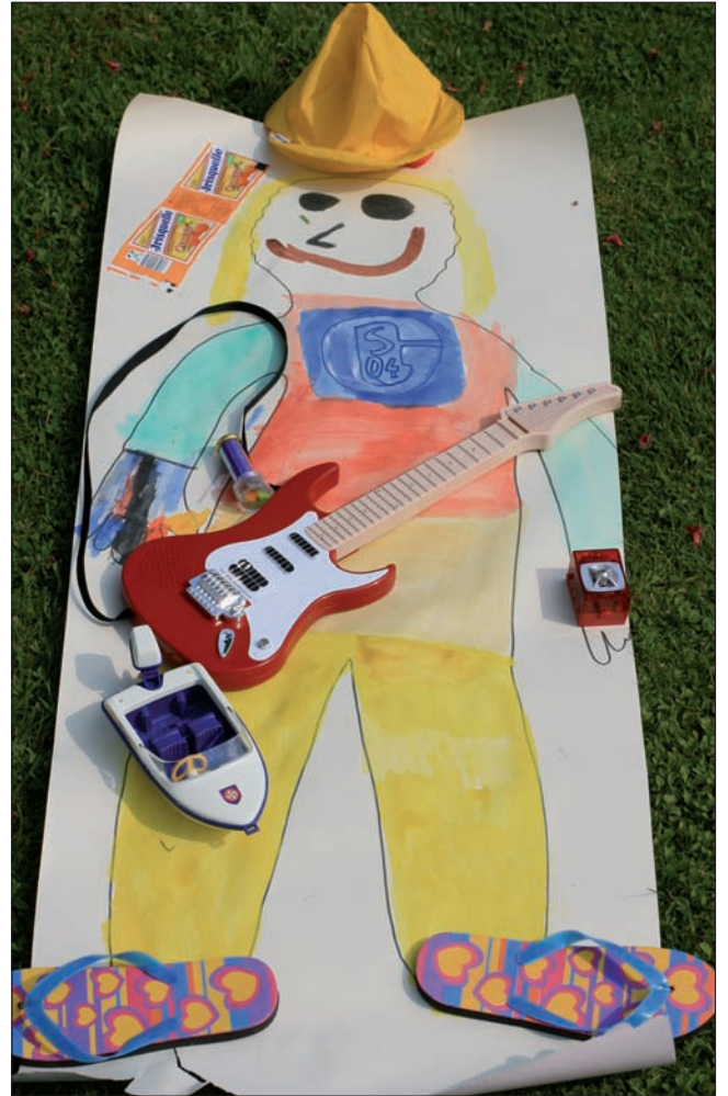
Das bin ich und das bist du