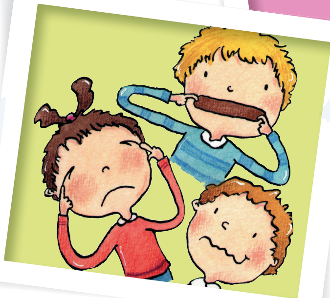
Heiterkeit: Grimassen schneiden